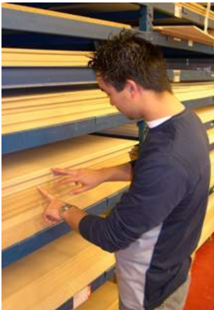
De Assistent houtbranche haalt plaatmateriaal uit het magazijn.