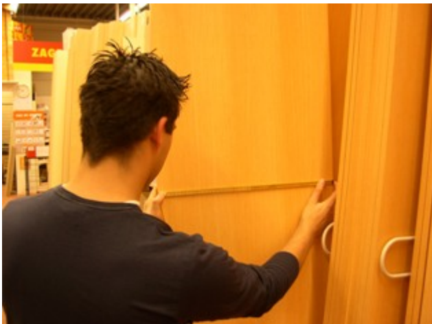
De Assistent houtbranche meet het plaatmateriaal.

In de houthandel zal hij vaak helpen met het inventariseren en verzamelen van hout en plaatmateriaal. Bij het verzamelen moet hij ook op de kwaliteit van het materiaal letten, bijvoorbeeld of het hout niet kromgetrokken is. De kenmerken waar hij op moet letten worden hem vooraf duidelijk verteld, zodat hij goed weet waar hij naar moet kijken.